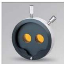
» Yellow Filter