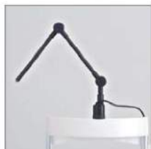
» External Fixation Target (SO-FTO2)