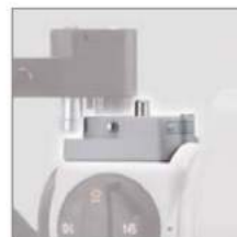
» Tonometer Mount for R900 (SO-TM1)