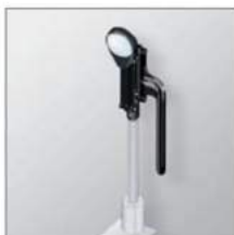
» Hruby Lens (SO-HLO1)