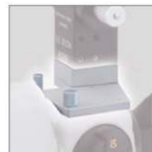
» Tonometer Mount for 870 (SO-TM2)